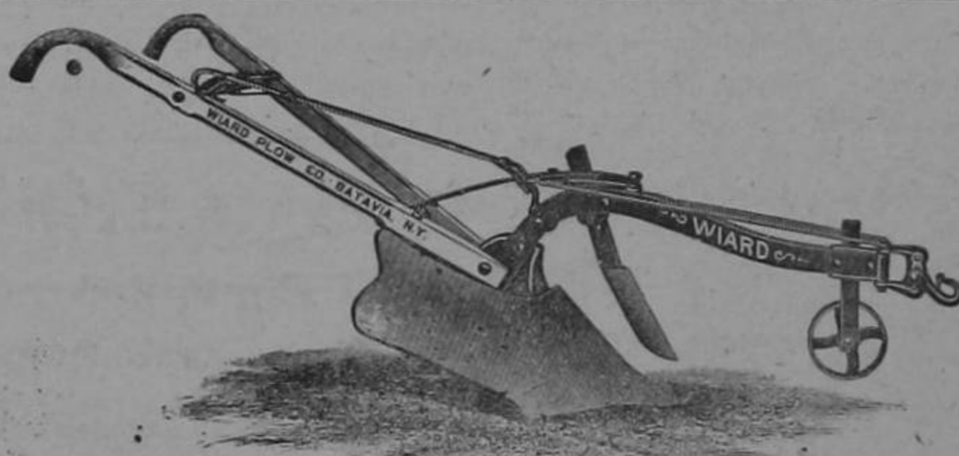
INODOROS AMERICANOS tanque alto y tanque bajo

Material para Cloacas Tubos, codos, sifones, tees, "Y" etc., todo de fabricación belga